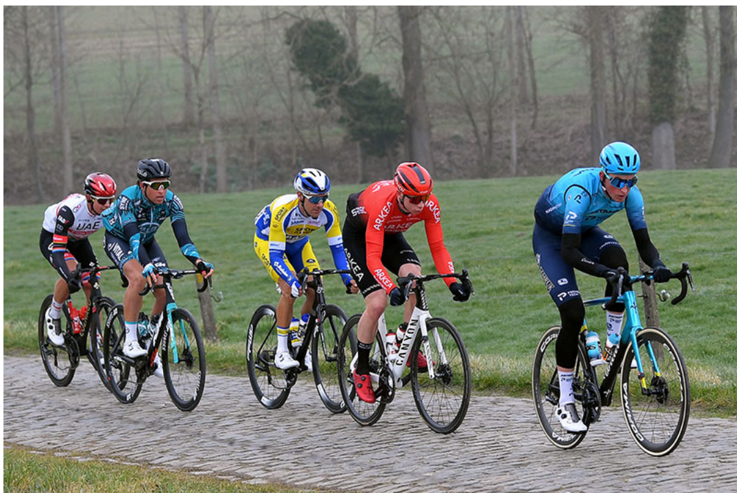
Kenny De Ketele in kopgroep Omloop het Nieuwsblad 2021